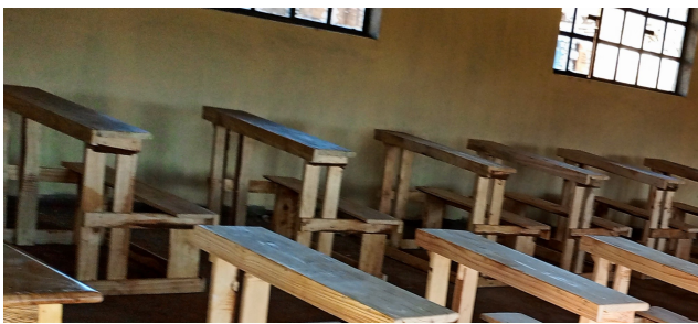
MAA comme d'habitude équipe chaque classe de 25 pupitres en bois, table et chaise pour le maître, tableau noir peint contre le mur.