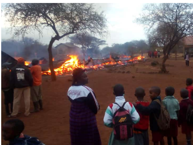
L'incendie qui a détruit les classes en bois à Essosian primary, Rombo, en juillet 2021