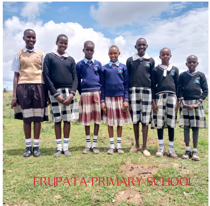
Erupata primary (primaire et C.O.)