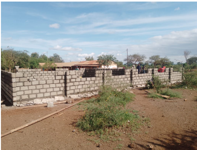
La construction a commencé en mars 2023