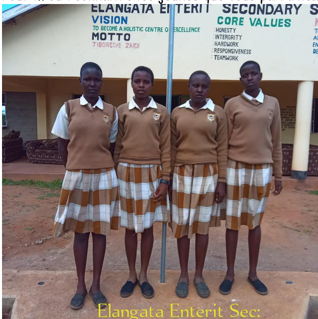
Elangata Enterit Sec:

Pour mieux connaître les jeunes que vous parrainez, voici quelques photos prises lors du 2 e trimestre de 2023.