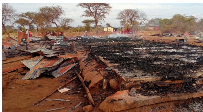
Les ruines des 2 classes brûlées. Essosian, Rombo