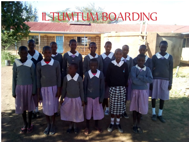
Iltumtum boarding (primaire et C.O.)