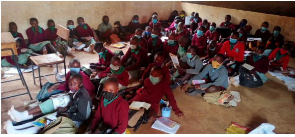
Essosian primary. Sans classe les élèves assis par terre.