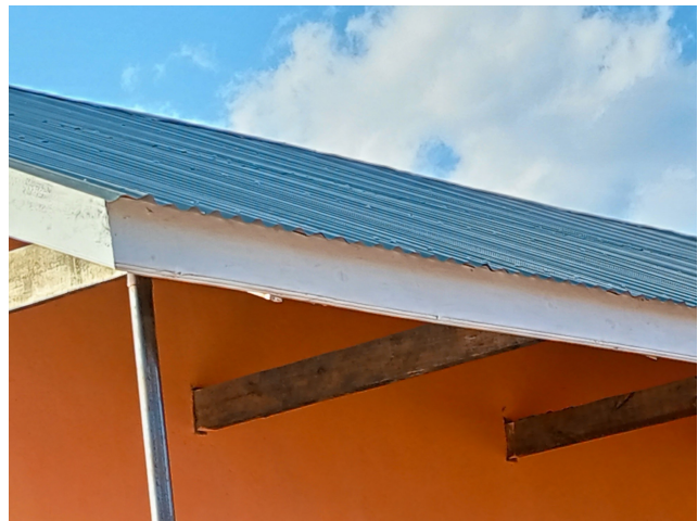
les 2 classes flambant neuves, en juin 2023