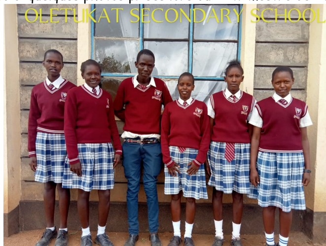
Oletukat secondary (Lycée)