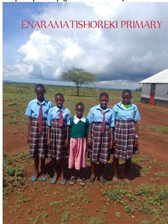
Enaramatishoreki primary (primaire et C.O.)