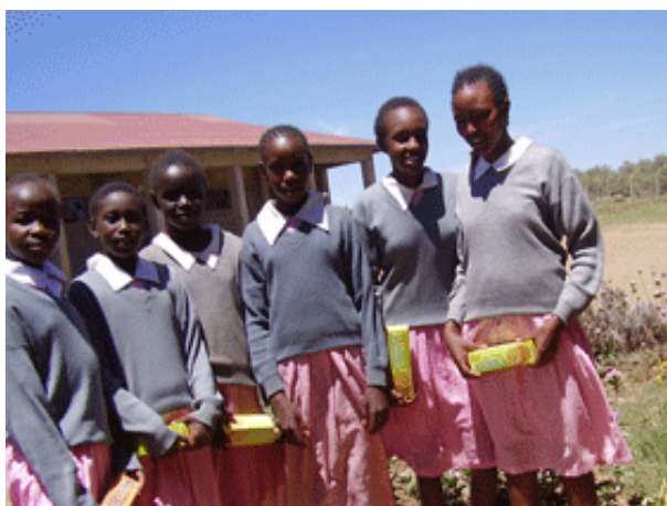
« Model Teachers » à Narok