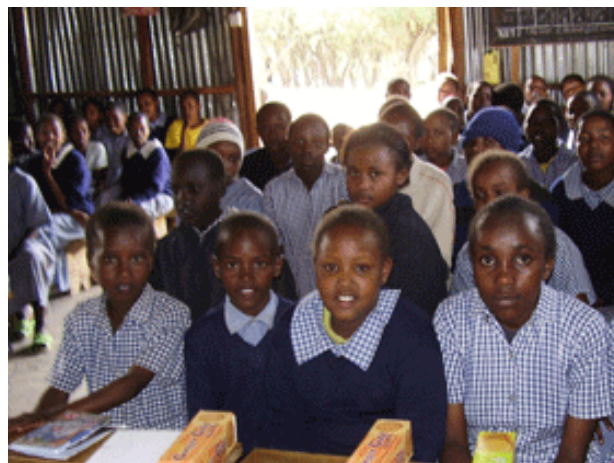
Ecole primaire « Vision Academy » Ololulunga