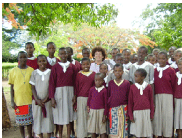
Rombo Girls – Rombo- Loitokitok