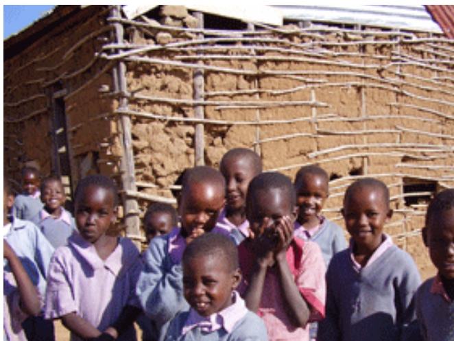
Ecole primaire de Iltumtum (Narok)

Grâce à vos dons, parrainages et cotisations, MAA a pu octroyer des bourses de scolarité à plus de 200 enfants au Kenya . Ces bourses permettent à des enfants massai démunis ou orphelins, en majorité des filles, d'accéder à l'école primaire mais aussi au Collège et au Lycée.