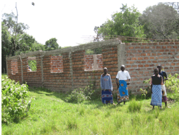
Les 3 classes abandonnées par manque de fonds.

Voici les photos que j'ai pu prendre lors de mon dernier passage à Inkorienito :