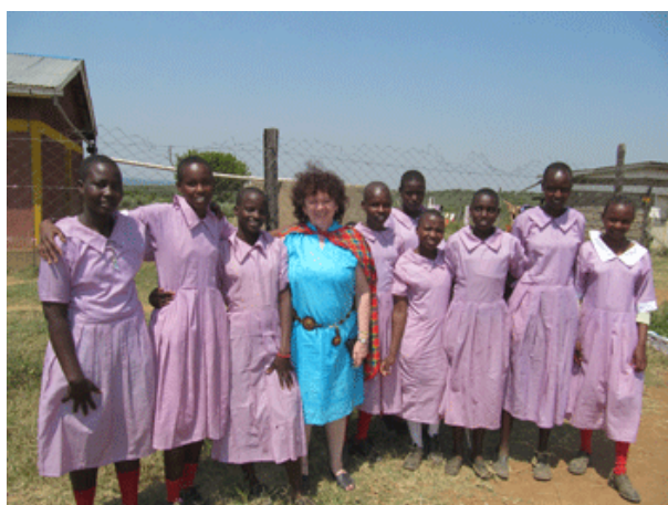
Avec quelques filles parmi la 20 e que nous scolarisons à Intumtum