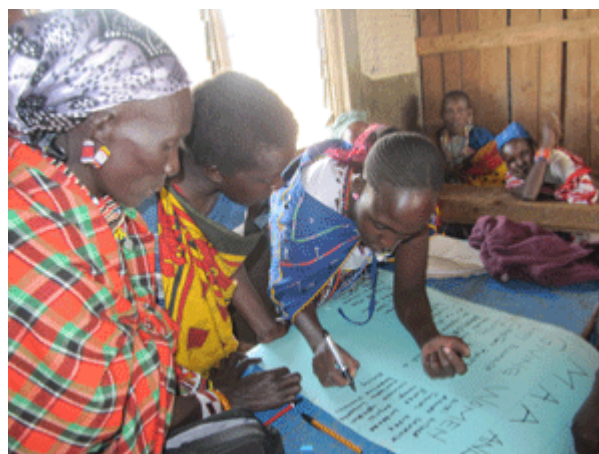
Toutes les femmes veulent signer la liste de remerciements à MAA et à GIVING WOMEN