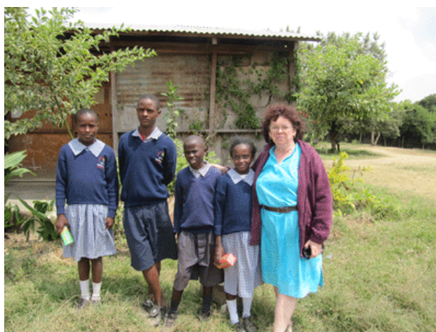
Avec quelques uns des élèves de la « Vision Academy » à Ololulunga, Narok