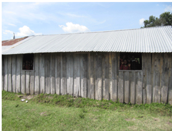
Les classes en tôle ondulée. En fonction.