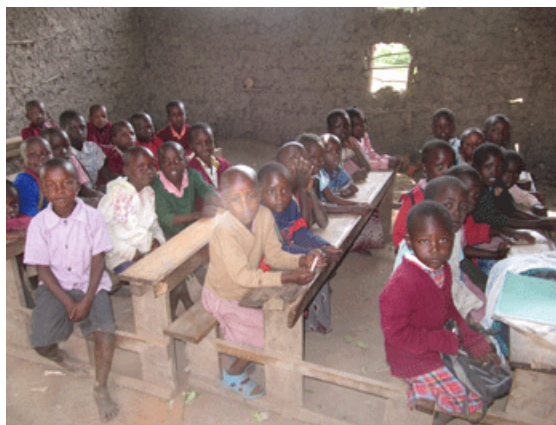
La classe maternelle en boue et branches qui s'est écroulée après les dernières pluies fortes.

Elle hébergeait 50-60 enfants de 5-6 ans.