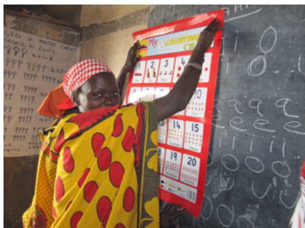
MAA a offert de nouvelles cartes pour la classe : les lettres et les nombres !